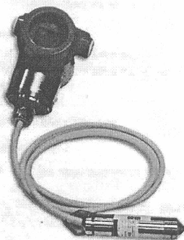
Рисунок 3 – Общий вид преобразователей исполнений ОВЕН ПД200-ДГ