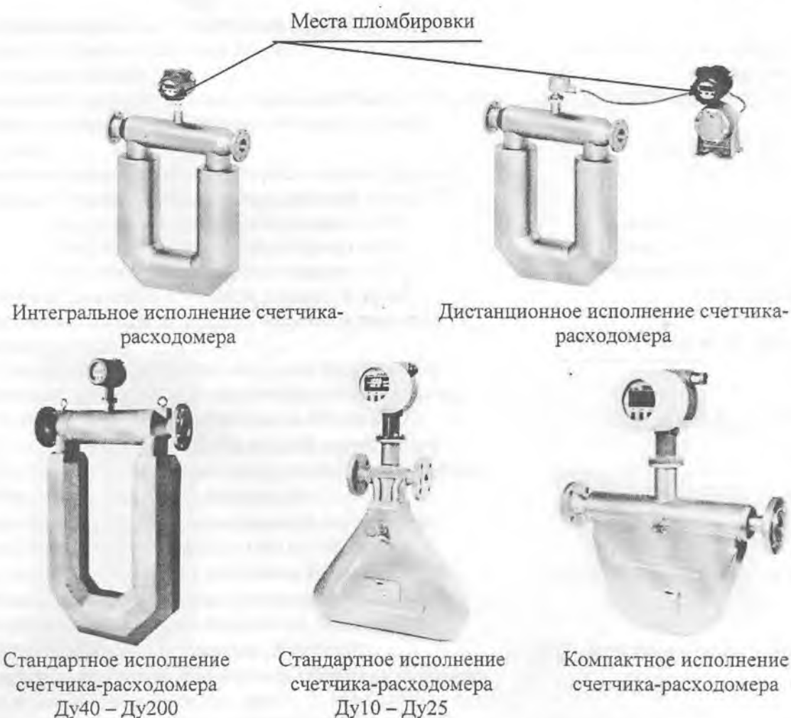
Рисунок 1 – Общий вид счетчиков-расходомеров «ЭМИС-МАСС 260» разных исполнений