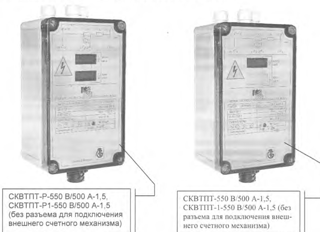
Рисунок 1 – Внешний вид счетчиков электрической энергии постоянного тока СКВТПП

Внешний вид счетчиков представлен на рисунке 1.