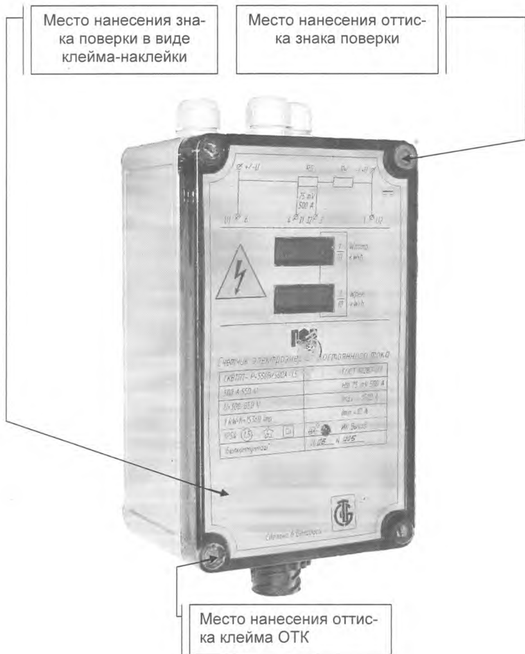
Рисунок А – Схема мест нанесения знака поверки в виде клейма наклейки и оттиска знака поверки