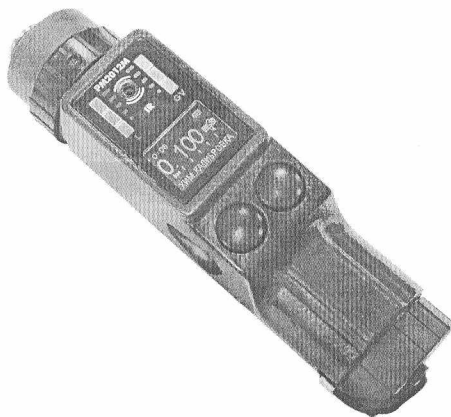
Рисунок 1 – Общий вид дозиметра

Общий вид дозиметра представлен на рисунке 1.