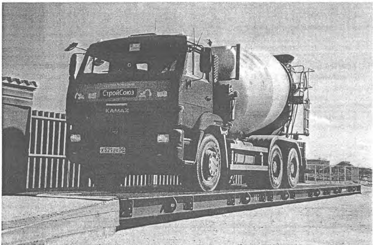
Рисунок 1 – Внешний вид весов ВА с установкой ГП на поверхности дорожного полотна.