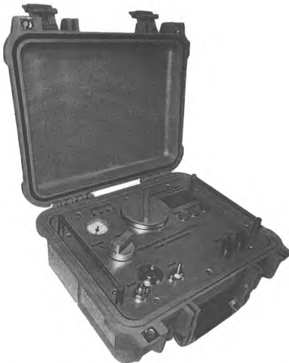
Рисунок 1 – Анализаторы содержания кислорода переносные КС 50.430-000, внешний вид