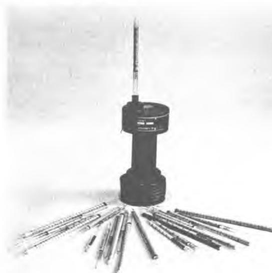
Рисунок 1. Внешний вид трубок индикаторных С-3.