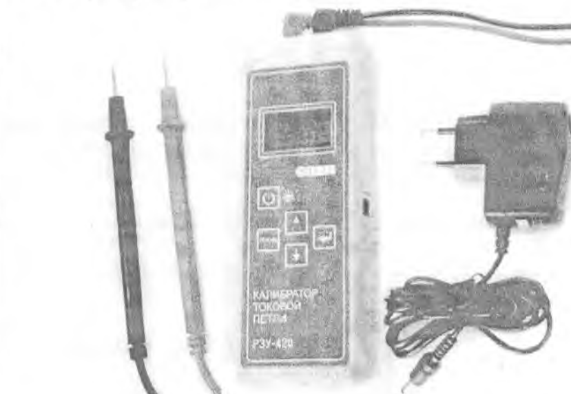
Рисунок 2 - Общий вид прибора с адаптером питания и подключенными измерительными выводами (щупами)