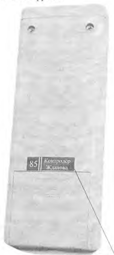
Пломба – наклейка

Для предотвращения несанкционированного доступа к внутренним частям приборов один из винтов крепления корпуса пломбируется.