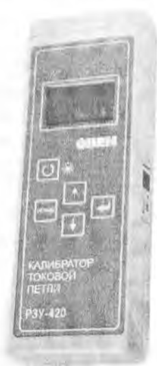
Рисунок 1 - Общий вид прибора

Фотографии общего вида приборов приведены на рисунках 1 и 2.