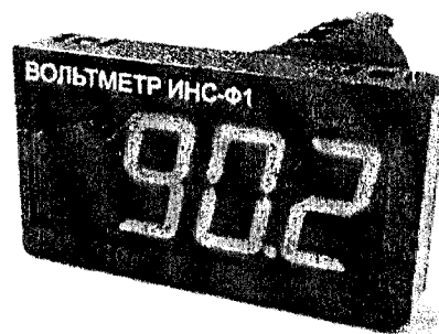
Общий вид приборов в корпусе Щ9 Рисунок 2

Приборы изготавливаются в нескольких вариантах исполнения, отличающихся друг от друга диапазоном измерений, конструкцией корпуса, напряжением питания.