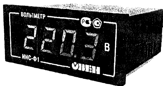
Общий вид приборов в корпусе ЩЗ Рисунок 1

Фотографии общего вида приборов приведены на рисунках 1 и 2.