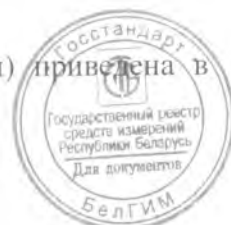
Схема с указанием мест нанесения знака поверки (клейма-наклейки) приведена в приложении к описанию типа.