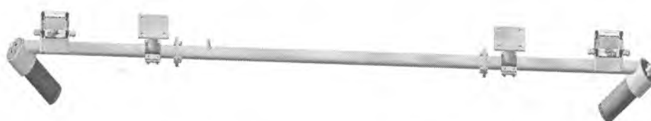
Модуль оптический МО