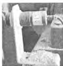
Датчик скорости импульсный ДСИ (ДСИ-Р)