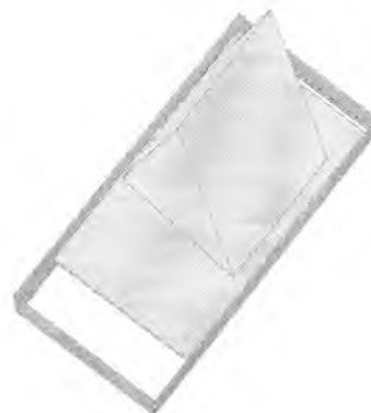
Калибр рабочий КР