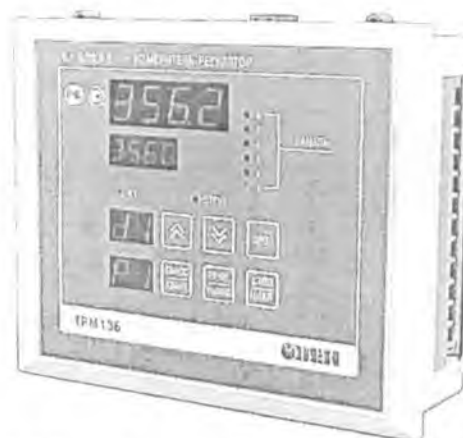
Рис.1 Общий вид приборов в корпусе «Щ4» Рис.2 Общий вид приборов в корпусе «Щ7»