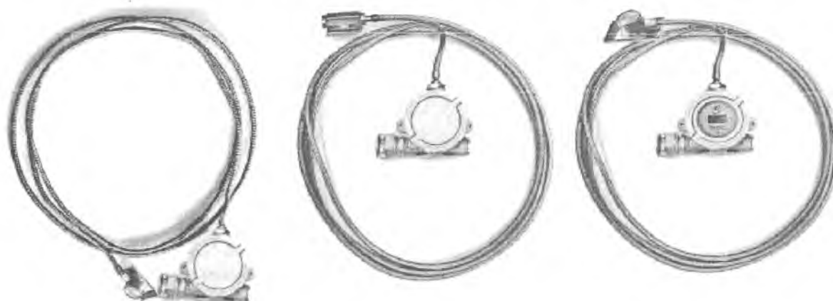
Рисунок 1 – Термопреобразователи сопротивления взрывозащищенные ТСМУ 011, ТСПУ 011

Фотографии общего вида ТП приведены на рисунке 1.