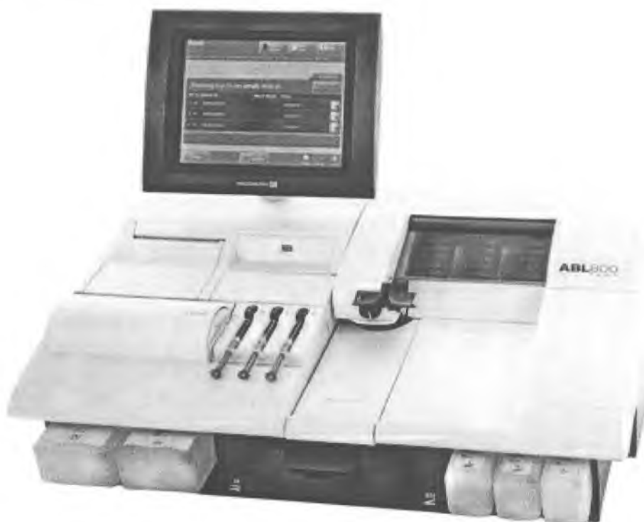
Рисунок 1 – Внешний вид анализатора крови ABL 800 FLEX

* – измерение параметра устанавливается по заказу