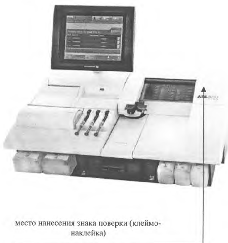
Рисунок А.1 – Место нанесения знака поверки (клеймо-наклейка) на анализаторы