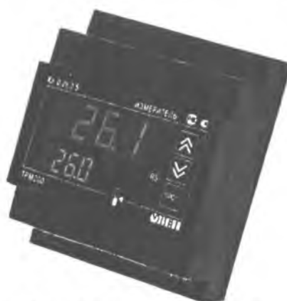
Рис.1 - Общий вид приборов в корпусе Д – для крепления на DIN-рейку

Фотографии общего вида приборов приведены на рисунках 1-4.