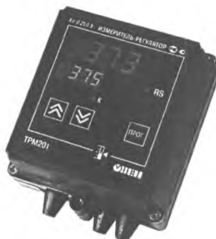
Рис.2 - Общий вид приборов в корпусе Н – для настенного крепления