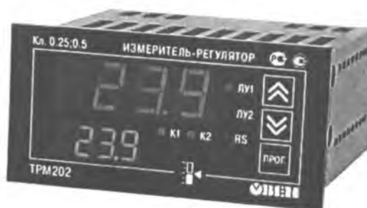
Рис.3 - Общий вид приборов в корпусе Щ2 – для щитового крепления