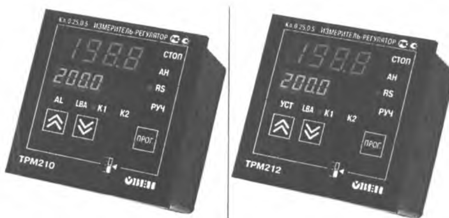
Рис.4 - Общий вид приборов в корпусе Щ1 – для щитового крепления