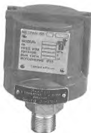
Рисунок 1 – Общий вид датчика давления Метран-55

Датчики имеют измерительный блок с тензорезисторным или емкостным преобразователем входной величины и аналоговый или микропроцессорный электронный преобразователь.