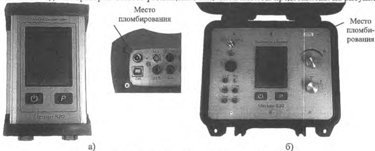
Рисунок 1 – Калибраторы давления Метран-520: а) калибратор портативного исполнения; б) калибратор кейсового исполнения.

Внешний вид калибраторов и место размещения защитной пломбы представлены на рисунке 1.