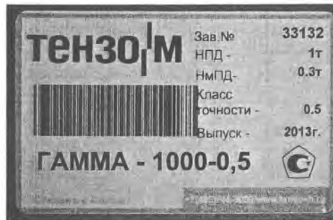
Рисунок 2 – Место нанесения знака поверки.

Место нанесения знака поверки показано на рисунке 2.