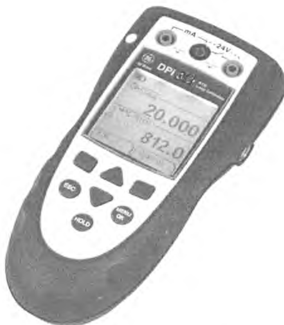
Рисунок 3 – Калибратор DPI 811