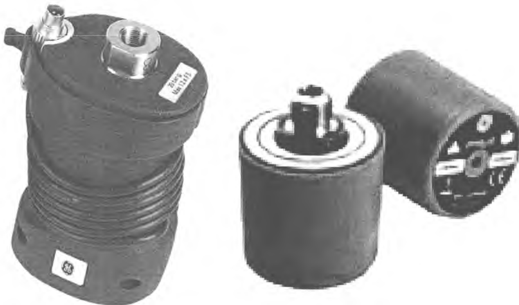
Рисунок 2 – Внешний универсальный модуль давления IDOS, PM 620