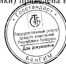
Схема с указанием мест нанесения знака поверки (клейма-наклейки) приведена в приложении к описанию типа.

Внешний вид калибраторов представлен на рисунках 1-3.