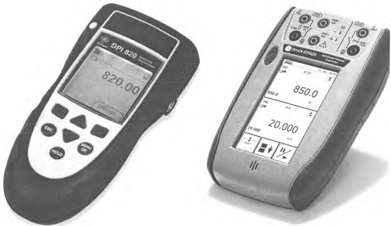
Рисунок 1 – Калибраторы многофункциональные серии DPI