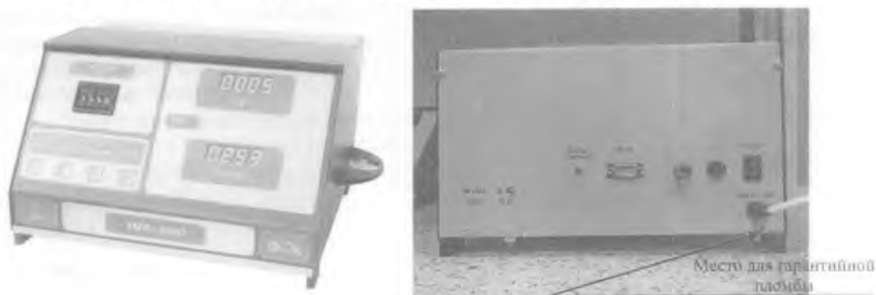
Рисунок 1 – Общий вид радиометра

Общий вид радиометра и место пломбирования представлены на рисунке 1.