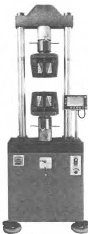
Рис. 2. Общий вид