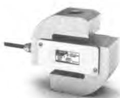
Рисунок 1 – Внешний вид датчиков С2

Внешний вид датчиков показан на рисунках 1 – 4.