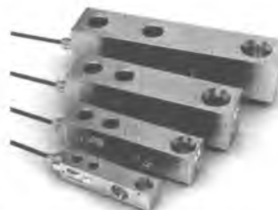
Рисунок 3 – Внешний вид датчиков Н4