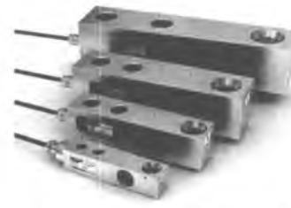
Рисунок 4 – Внешний вид датчика Н5

Маркировка датчиков производится на фирменной наклейке, на которой нанесены: