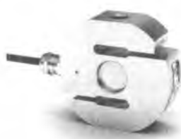
Рисунок 2 – Внешний вид датчиков С2Н