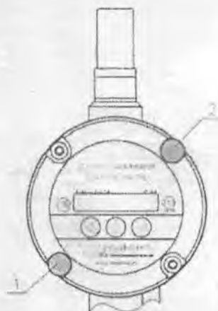
Рисунок 2 - Схема пломбирования датчика давления Turbo Flow PS.

При первичной и периодической проверке поверительное клеймо наносится способом давления на специальную мастику в места, указанные на рисунке 2 (2) по диагонали от пломбы предприятия – изготовителя.