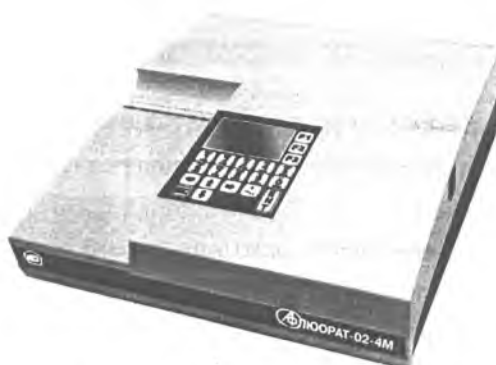
Рис.1 - Внешний вид анализаторов жидкости люминесцентно-фотометрических «Флюорат-02»