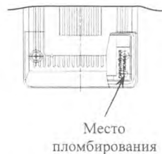
Блок преобразовательный (вид сзади)