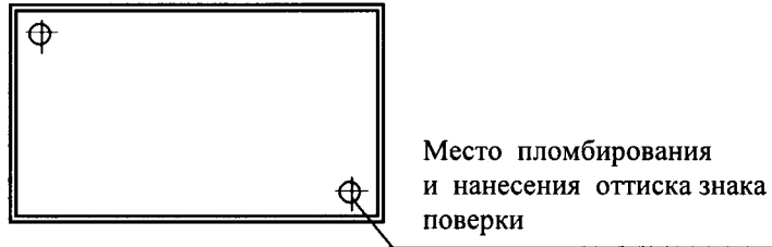
Схема пломбировки прибора