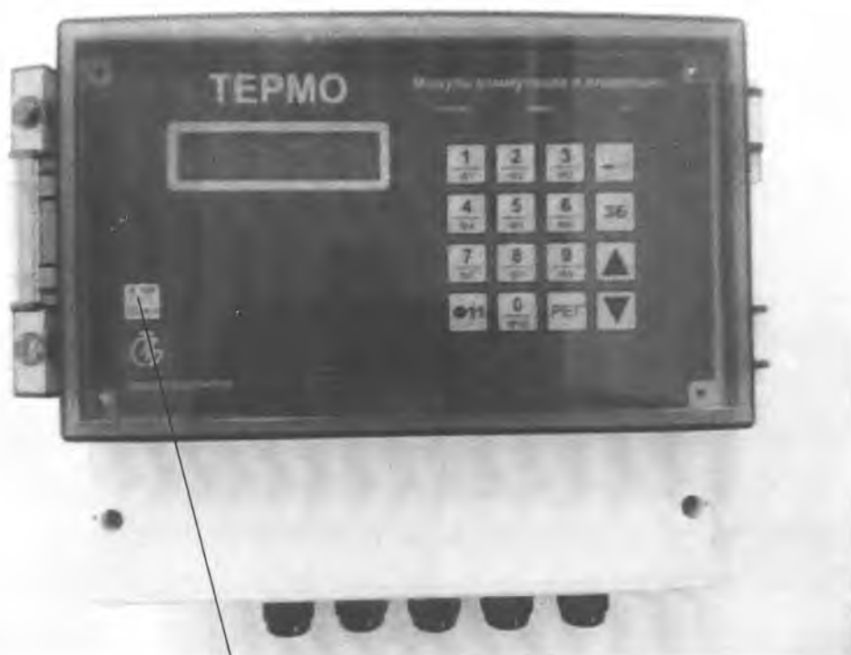
Схема нанесения Знака поверки

Место нанесения Знака поверки в виде клейма-наклейки