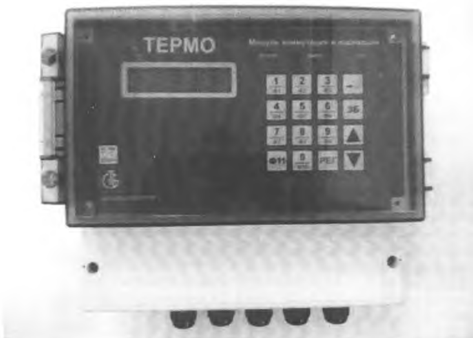
Рисунок 1 - Внешний вид модуля коммутации и индикации