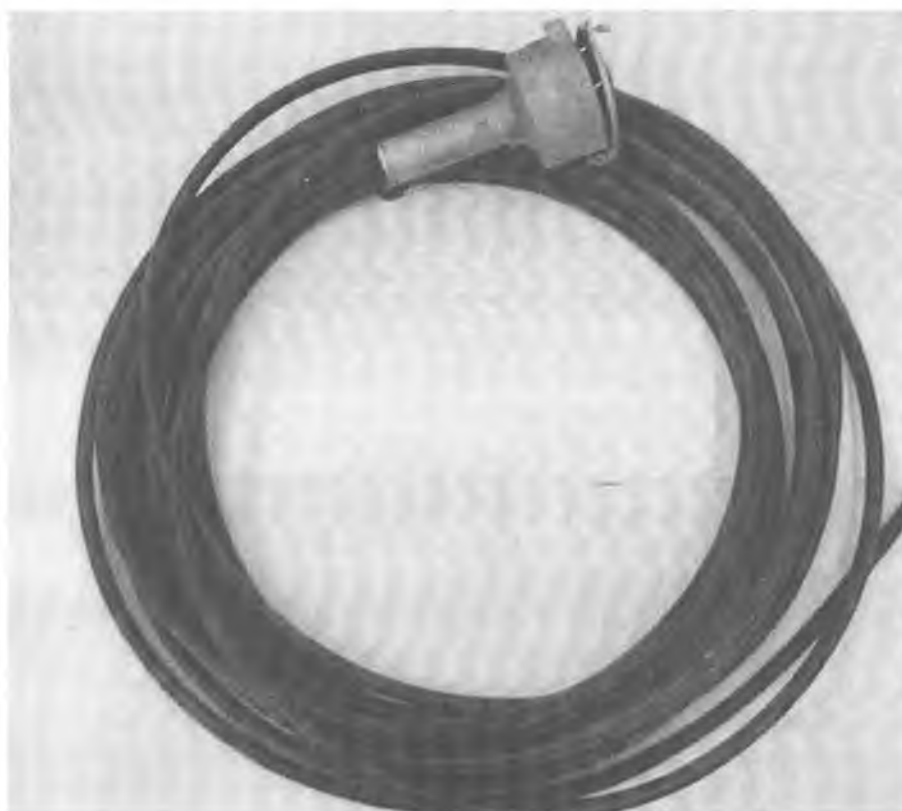
Рисунок 2 - Внешний вид модуля термоподвески