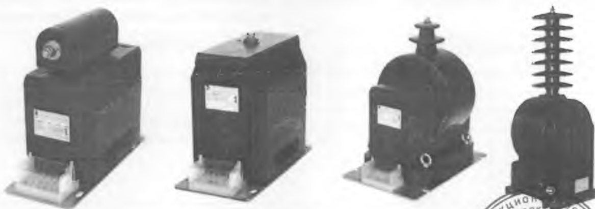
Рисунок 1 – Фотографии общего вида трансформаторов напряжения ЗНОЛ-СЭЩ-6, ЗНОЛ-СЭЩ-10, ЗНОЛ-СЭЩ-15, ЗНОЛ-СЭЩ-20, ЗНОЛ-СЭЩ-35, ЗНОЛ-СЭЩ-35-IV

Принцип действия трансформаторов основан на явлении электромагнитной индукции переменного тока.