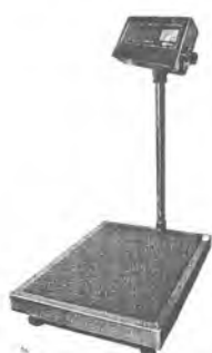
МП 60 ВДА Ф-2 (20; 400x500)

Общий вид весов представлен на рисунке 1.