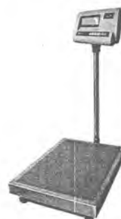
МП 60 ВЖА Ф-2 (20; 400x500)