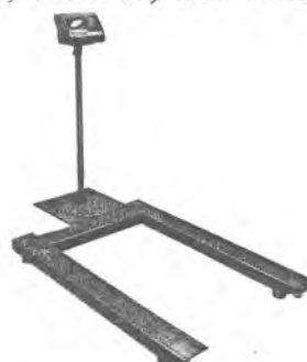
МП 600 ВЕДА Ф-1(200; 1200x800)