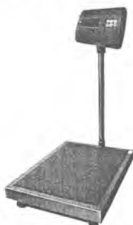
МП 150 ВЖА Ф-2 (20/50; 400x500)