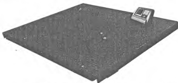
МП 2000 МЕДА Ф-1 (1000; 1500x1500)