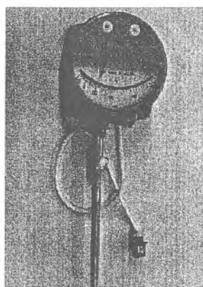
местный радиальное исполнение