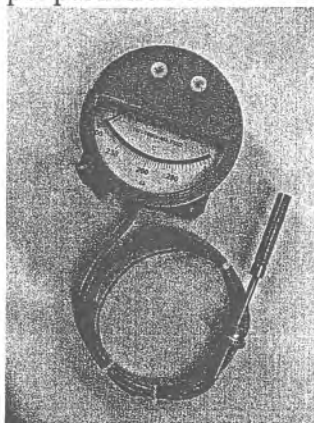
дистанционный настенное исполнение