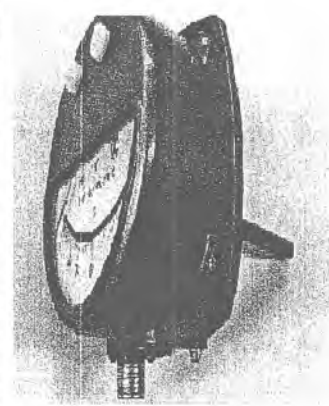
местный осевое исполнение