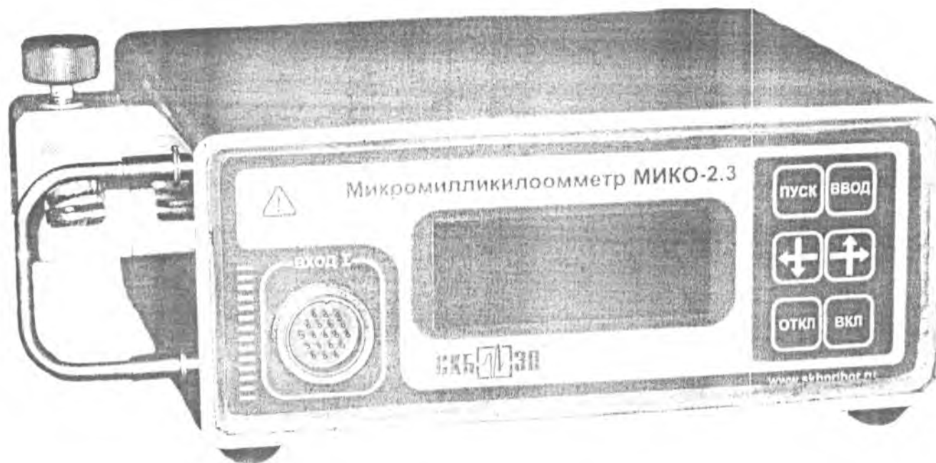
Рис. 1 Измерительный блок

Программное обеспечение не оказывает влияния на метрологические характеристики прибора.