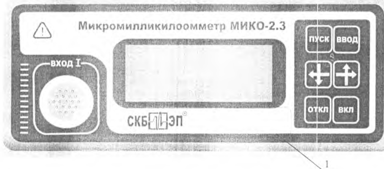
Рис. 2. Схема панели

1. Место для нанесения оттисков клейм или размещения наклеек.