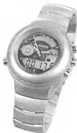
Рисунок 1 – Внешний вид дозиметра

Общий вид дозиметра представлен на рисунке 1.