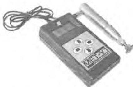
Рисунок 1 – Внешний вид твердомера МЕТ-У1

Внешний вид твердомера МЕТ-У1 приведён на рисунке 1, схема пломбировки от несанкционированного доступа на рисунке 2.