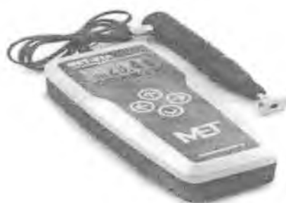
Рисунок 3 – Внешний вид твердомера MET-U1A