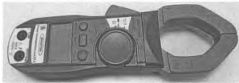
Рисунок 1 – Клещи токоизмерительные КТ-4. Внешний вид

Места нанесения на клещах оттиска поверительного клейма и поверительного клейма-наклейки приведены в приложении А.