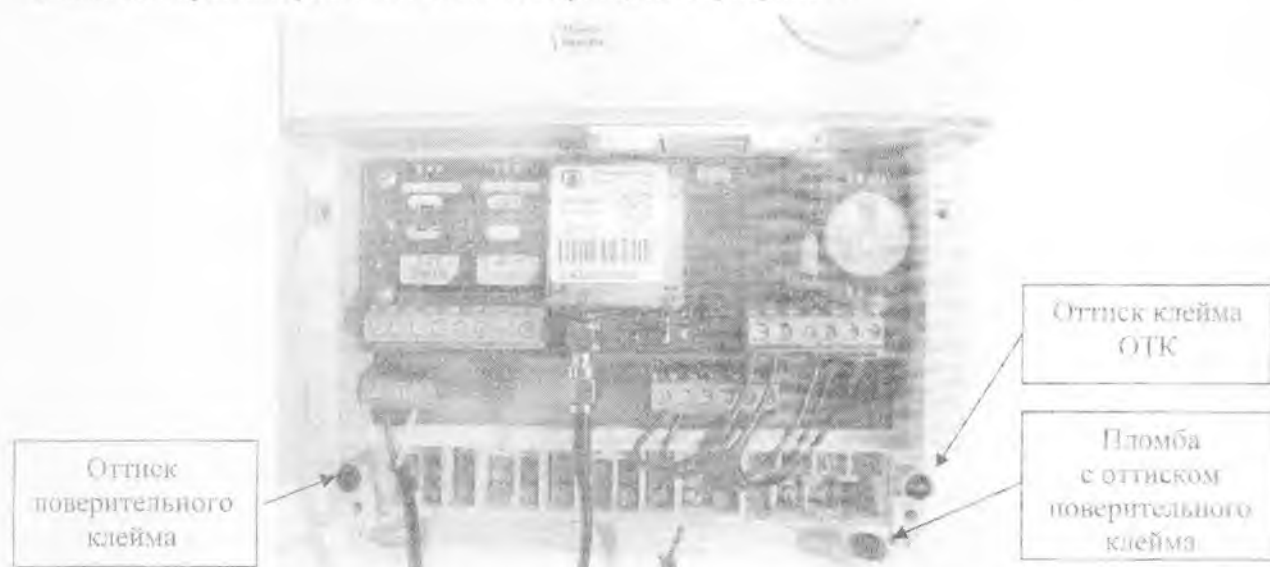
Рисунок 2 – Внешний вид отсека для установки дополнительных интерфейсных модулей

Внешний вид отсека для установки дополнительных интерфейсных модулей с установленным коммуникатором GSM C-1.02.01 приведен на рисунке 2.