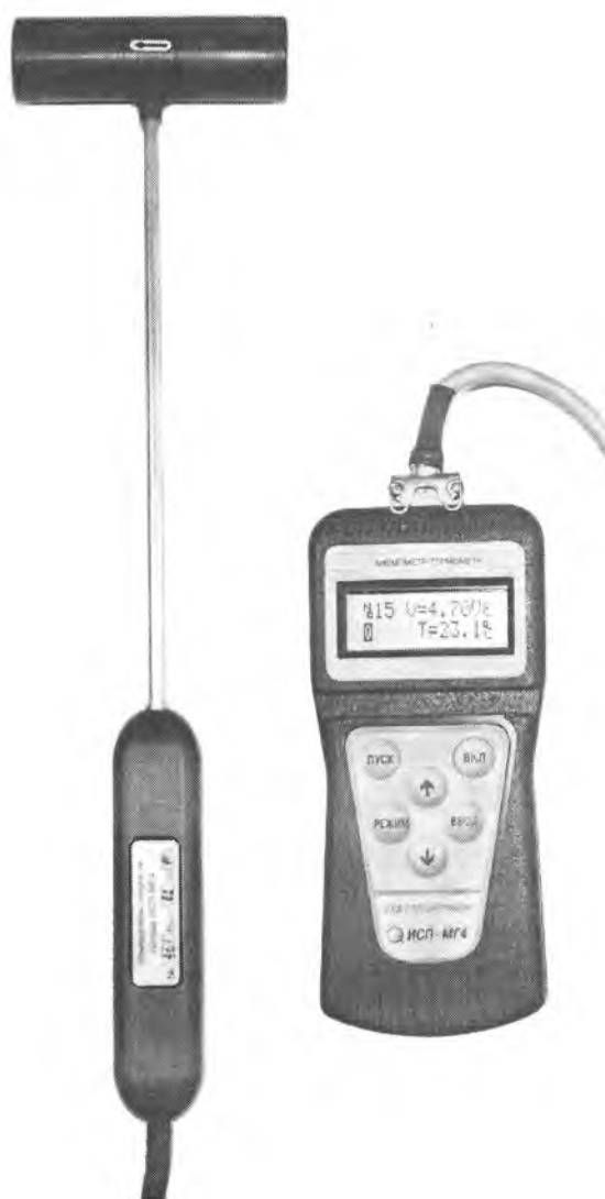
Рисунок 1 – Внешний вид анемометра-термометра цифрового ИСП-МТ4