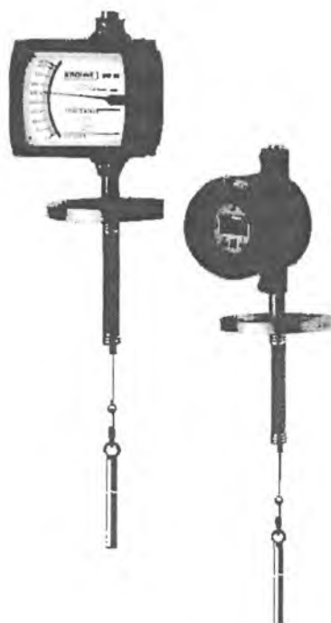
Внешний вид уровнемеров буйковых BW 25