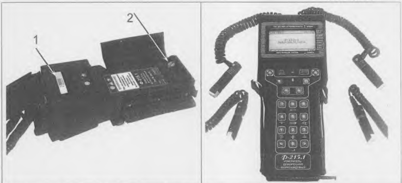
Фото 1 - Общий вид измерителя-дефектоскопа феррозондового Ф-215.1