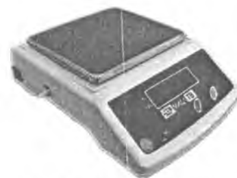
MT 3 В1ДА (0,5/1; 125x145)