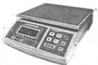
MT 6 ВДА (1/2; 220x270)