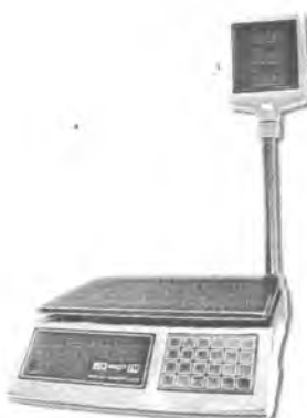
MT 15 МГЖА (2/5; 230x330)