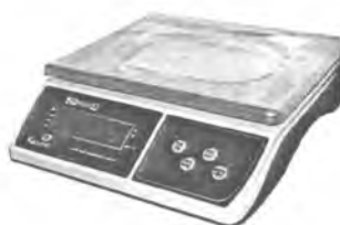
MT 15 В1ЖА (2/5; 230x300)