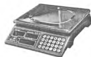
MT 30 МДА (5/10; 230x300)