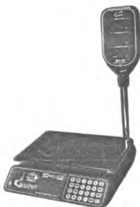
MT 30 МГДА (5/10; 230x330)