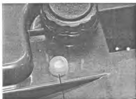
чашевидная оснастка с пломбой

Знак поверки в виде наклейки наносится на лицевую панель весов. Для защиты от несанкционированного доступа к внутренним частям весов и изменений параметров их настройки и юстировки в зависимости от исполнения весов устанавливается либо пломба на крепежный элемент корпуса внутри специальной чашевидной оснастки, либо пломбируется переключатель настройки (рисунок 2).