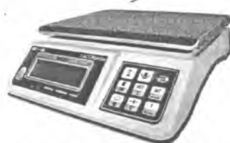
MT 15 В1ДА (2/5; 230x320)