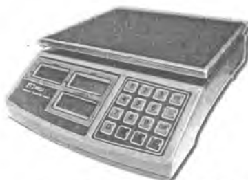
MT 15 МЖА (2/5; 220x270)