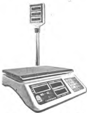
MT 30 МГДА (5/10; 230x320)

Общий вид весов представлен на рисунке 1.