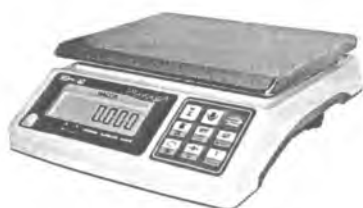
MT 6 ВДА (1/2; 230x290)