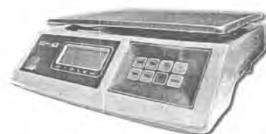
MT 30 ВЖА (5/10; 230x330)