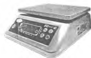
MT 6 В1ДА (2; 225x185, нерж.)