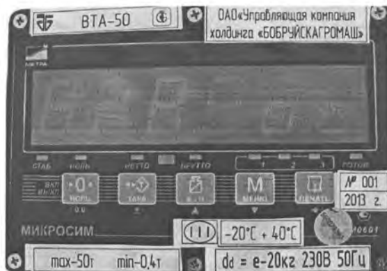
Рисунок 1. Показывающее устройством "Микросим М0601" (исполнение 1)

Показывающие устройства и общий вид весов ВТА приведен на рисунках 1-3.