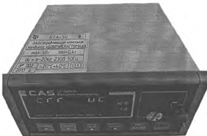
Рисунок 2. Показывающее устройством СИ-6000А (исполнение 2)