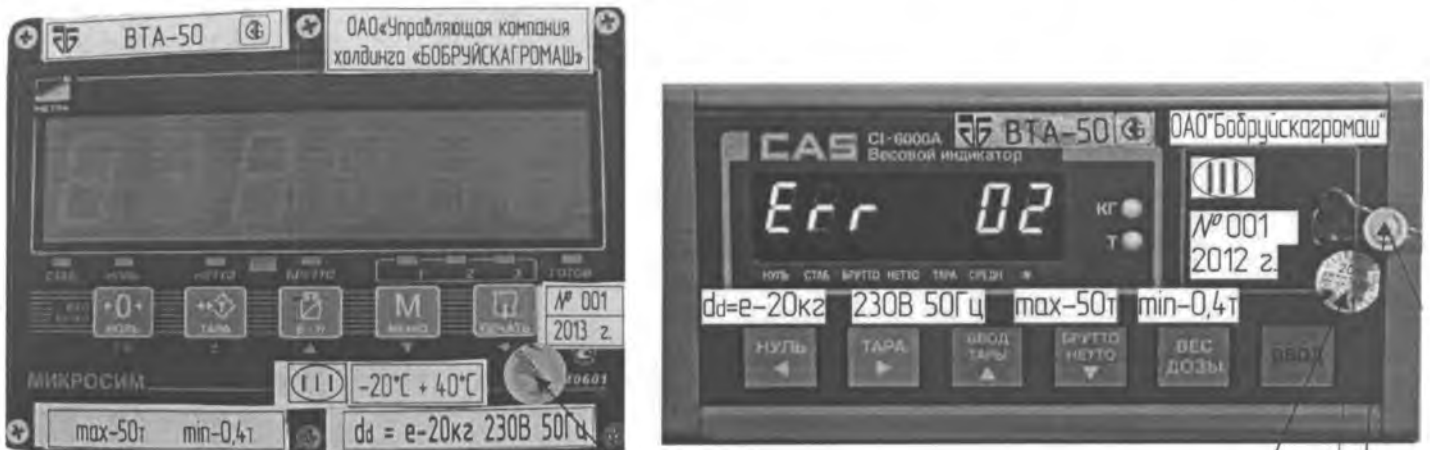
Схема пломбирования весов и размещение знака поверки в виде клейма-наклейки

Место нанесения знака поверки в виде клейма-наклейки