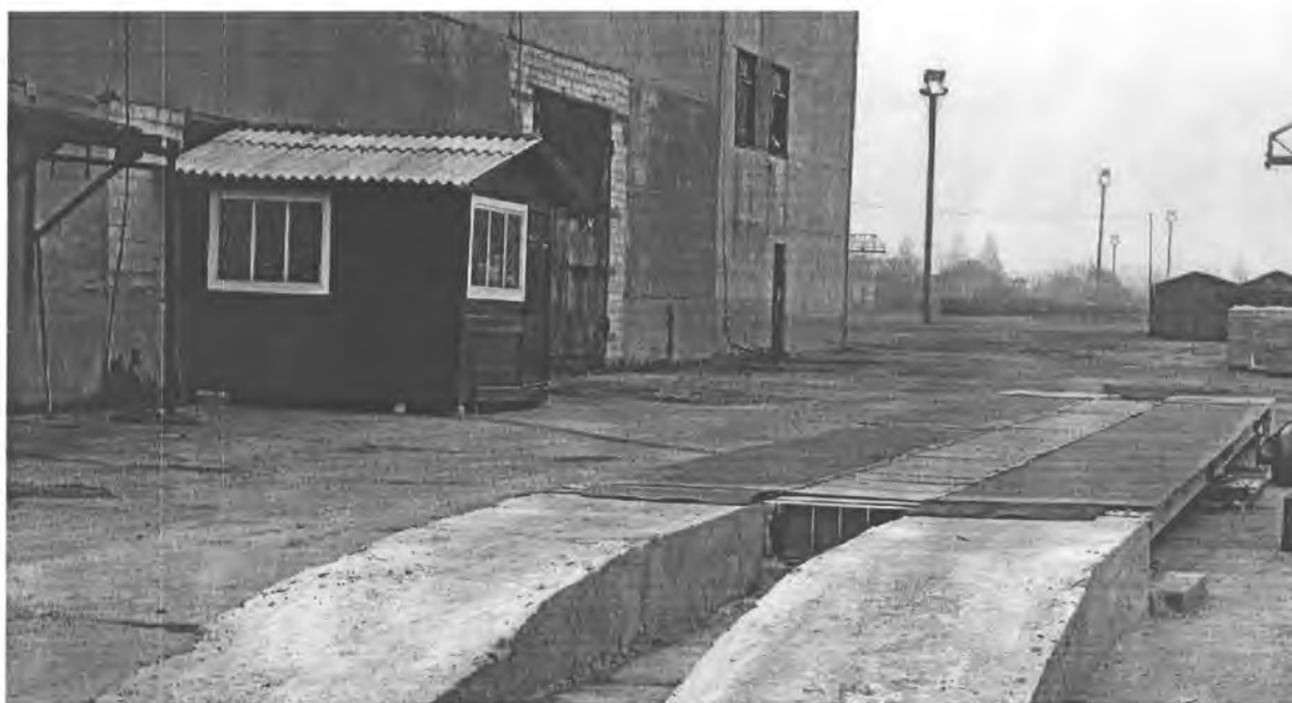
Рисунок 3. Общий вид весов ВТА.