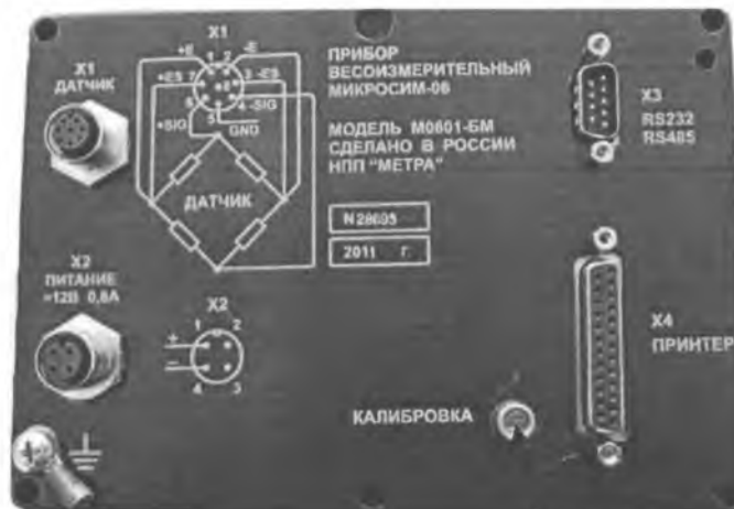
Рисунок А1. Место нанесения знака поверки в виде клейма наклейки.

Место нанесения знака поверки в виде клейма-наклейки