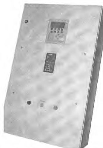
Рис. 2. Общий вид пульта управления