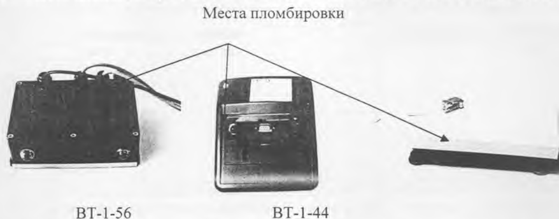
Рисунок 6 - Места пломбировки от несанкционированного доступа весов в исполнении П с индикаторами ВТ-1-56 и ВТ-1-44