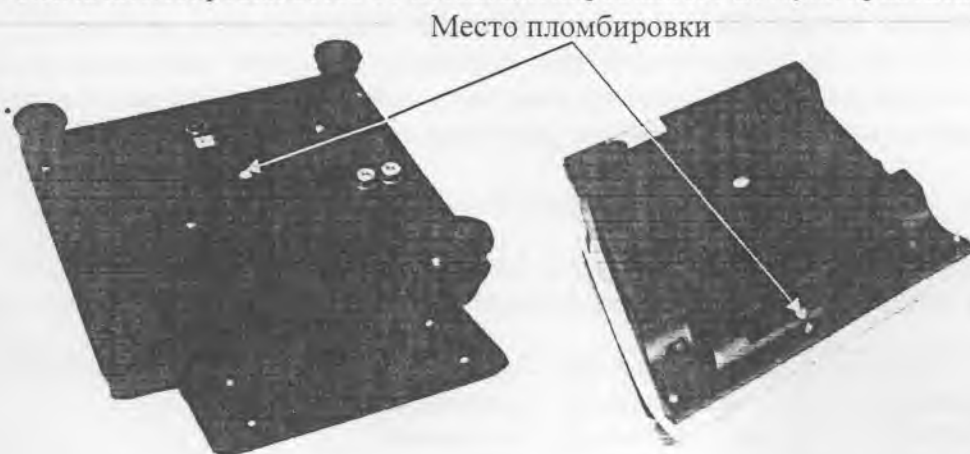
Рисунок 5 - Место пломбировки от несанкционированного доступа весов в исполнении Н

Схема пломбировки весов от несанкционированного доступа приведена на рисунках 5-7.