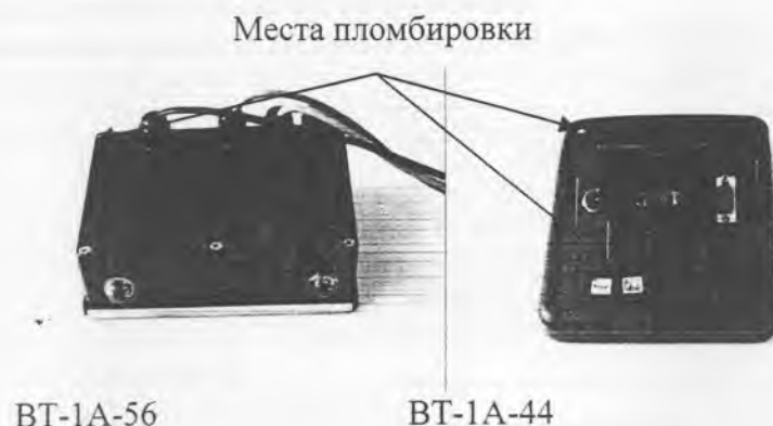
Рисунок 7 - Места пломбировки от несанкционированного доступа весов в исполнении П с индикаторами VT-1A-56 и VT-1A-44