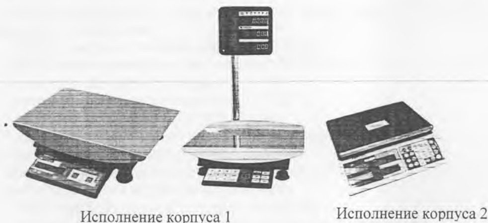
Рисунок 1 - Общий вид весов в исполнении Н

- П – весы с грузоприемным устройством, которое представляет собой механическую конструкцию, опирающуюся на один или четыре весоизмерительных датчиков (далее - весоизмерительная платформа) и отдельным индикатором. Индикатор может быть установлен на стойку (рисунок 2). Общий вид индикаторов приведен на рисунке 3.