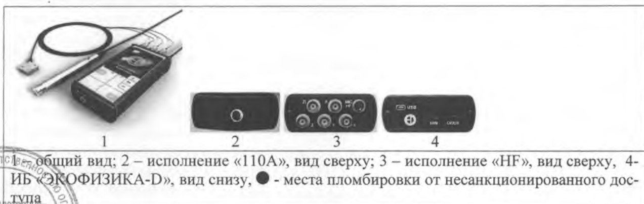
1 – общий вид; 2 – исполнение «110А», вид сверху; 3 – исполнение «HF», вид сверху, 4 – ИБ «ЭКОФИЗИКА-D», вид снизу, ● - места пломбировки от несанкционированного доступа

Принцип действия в качестве шумомера-виброметра основан на преобразовании звукового давления либо ускорения в сигнал электрического напряжения с помощью конденсаторных микрофонов и, соответственно, вибропреобразователей и на последующем измерении уровней этого электрического сигнала в ИМ с помощью аналого-цифрового преобразования и обработки специализированным микропроцессором. Принцип действия в качестве многофункционального анализатора состоит в частотном анализе электрических сигналов, поступающих на входы ИМ с помощью аналого-цифрового преобразования и обработки цифровых выборок исходных сигналов специализированным микропроцессором. Информация о состоянии прибора и измеренных величинах отображается на индикаторе ИБ. Прибор имеет следующие режимы измерения: «Экозвук», «Ультразвук-100кГц», «Общая вибрация», «Локальная вибрация», «Анализ 4-НФ», «Анализ -ЕF», «Анализ -MF», «Анализ -LF», «Анализ -EF», «Анализ 1/12», «БПФ-1», «Микровольтметр», «Сел.вольтметр», «Полосовые фильтры». ИБ имеет энергонезависимую память для записи служебной информации и результатов измерений. ИБ подключается к персональному компьютеру через USB-порт и распознается в качестве стандартного USB-накопителя. Результаты измерения из памяти ИБ могут быть представлены на компьютере в удобном для изучения виде с помощью программного обеспечения, поставляемого с прибором. Прибор питается от аккумуляторов. В случае необходимости, аккумуляторы могут быть заменены стандартными элементами питания типоразмера АА