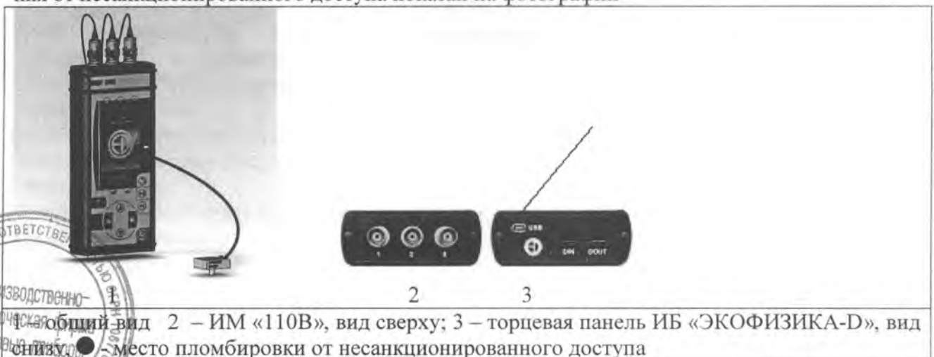
Рис. 1 – общий вид 2 – ИМ «110В», вид сверху; 3 – торцевая панель ИБ «ЭКОФИЗИКА-D», вид снизу. Место пломбировки от несанкционированного доступа