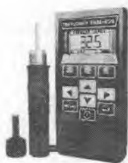
Рисунок 1.- Внешний вид вид модификации ТКМ-459М 459С

Модификация ТКМ-459С оснащается цветным дисплеем, содержит расширенный набор сервисных функций программного обеспечения. Модификация ТКМ-459М оснащается чёрно-белым дисплеем, содержит сокращённый набор сервисных функций ПО. Метрологические характеристики у модификаций твердомера одинаковые.