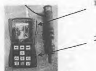
Рисунок 4. - схема пломби- модификации ТКМ-459С 1,2 - места пломбировки