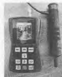
Рисунок 2. - Внешний модификации ТКМ-