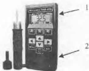
Рисунок 3. - схема пломбировки пломби модификации ТКМ-459М 1,2-места пломбировки