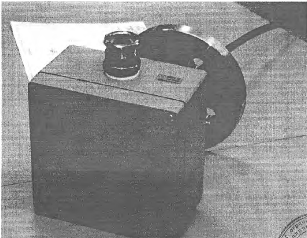
Рисунок 2 – Внешний вид