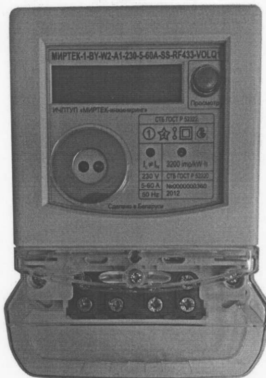
Рисунок 3 – Внешний вид счетчика в корпусе модификации W2