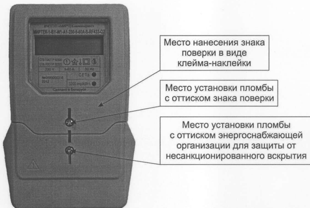
Рисунок А.1 – Места установки пломб и нанесения знака поверки для счетчиков в корпусе модификации W1

Места установки пломб и нанесения знака поверки