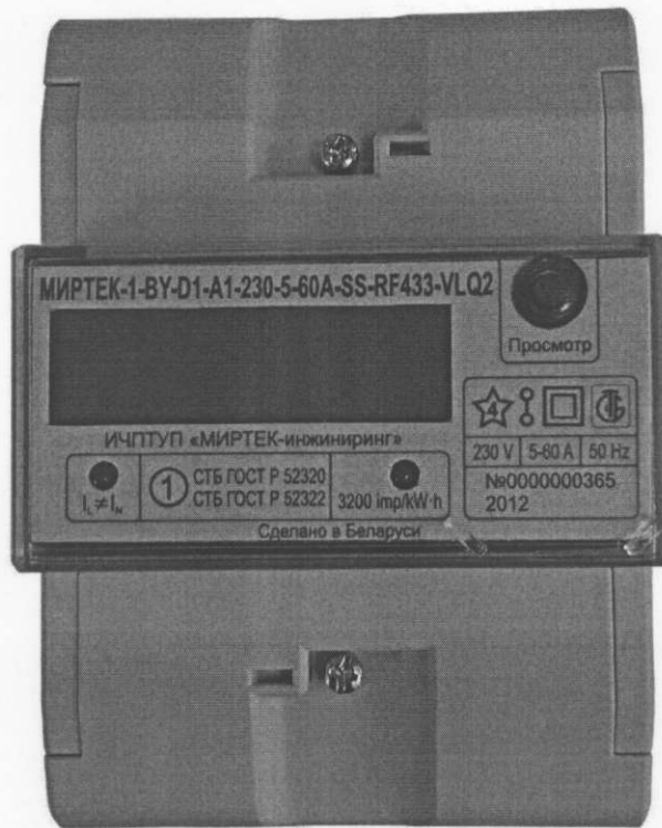
Рисунок 4 – Внешний вид счетчика в корпусе модификации D1

Счетчик ведет учет электрической энергии по действующим тарифам (до 4) в соответствии с месячными программами смены тарифных зон (количество месячных программ – до 12, количество тарифных зон в сутках – до 48). Месячная программа может содержать суточные графики тарификации рабочих, субботних, воскресных и специальных дней. Количество специальных дней (праздничные и перенесенные дни) – до 45. Для специальных дней могут быть заданы признаки рабочей, субботней, воскресной или специальной тарифной программы. Счетчик содержит в энергонезависимой памяти две тарифных программы – действующую и резервную. Резервная тарифная программа вводится в действие с определенной даты, которая передается отдельной командой по интерфейсу.