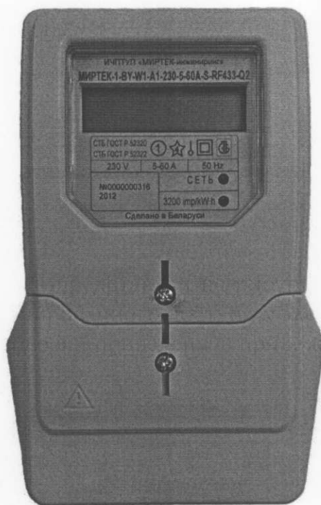
Рисунок 2 – Внешний вид счетчика в корпусе модификации W1

Внешний вид счетчика представлен на рисунках 2-4. Схемы пломбирования счетчиков от несанкционированного доступа к элементам счетчика с указанием мест нанесения знаков поверки приведены в приложении А.