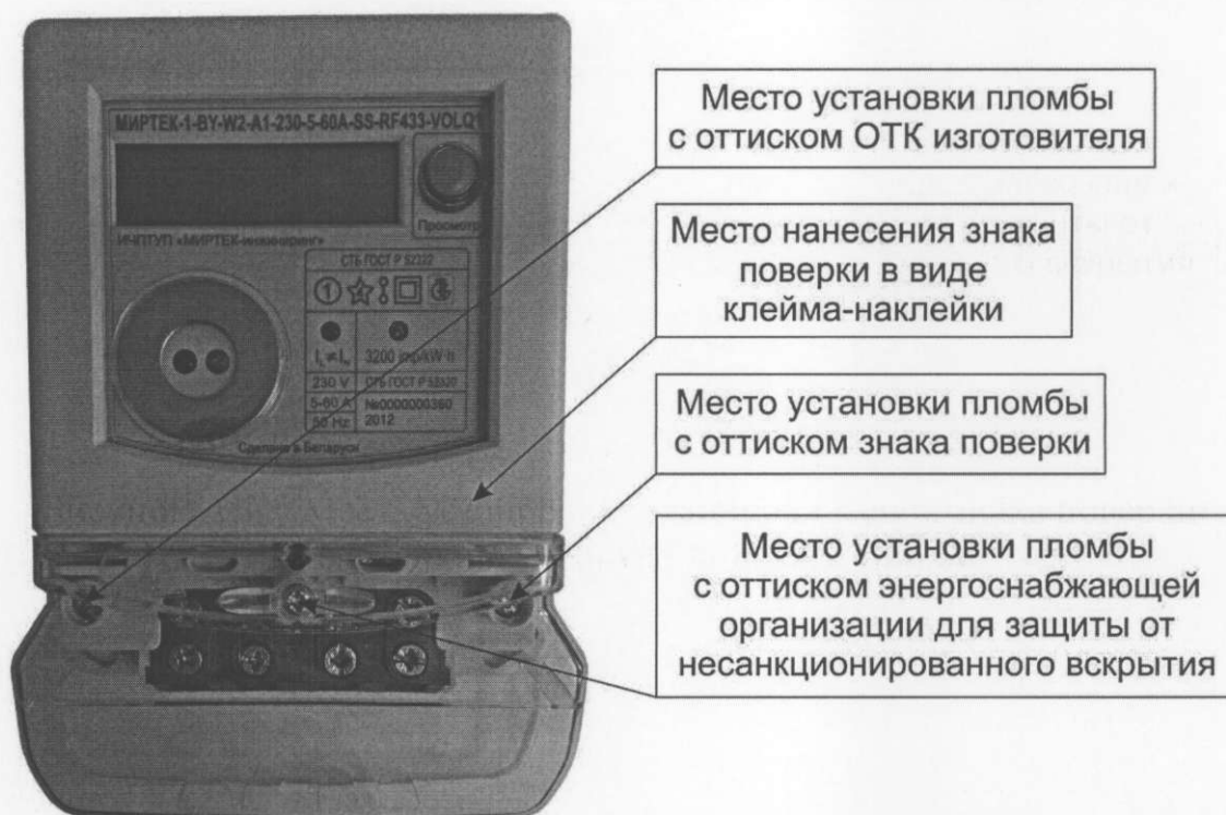
Рисунок А.2 – Места установки пломб и нанесения знака поверки для счетчиков в корпусе модификации W2