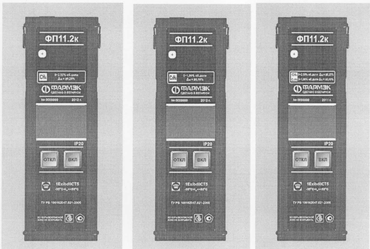
Рисунок 16. Внешний вид газоанализаторов ФП11.2к с термокаталитическим датчиком

Схема пломбировки для защиты от несанкционированного доступа к элементам схемы и место для нанесения знака поверки в виде клейма-наклейки приведена в приложении А к Описанию типа.