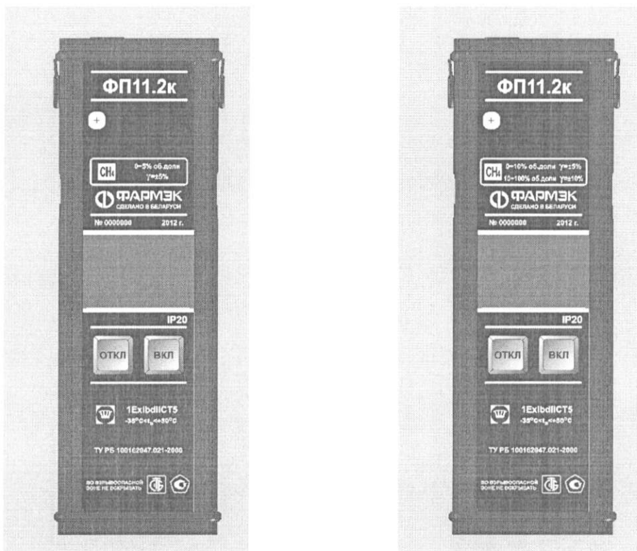
Рисунок 1а. Внешний вид газоанализаторов ФП11.2к с оптическим датчиком

Внешний вид газоанализаторов ФП11.2к приведен на рисунках 1а и 1б.