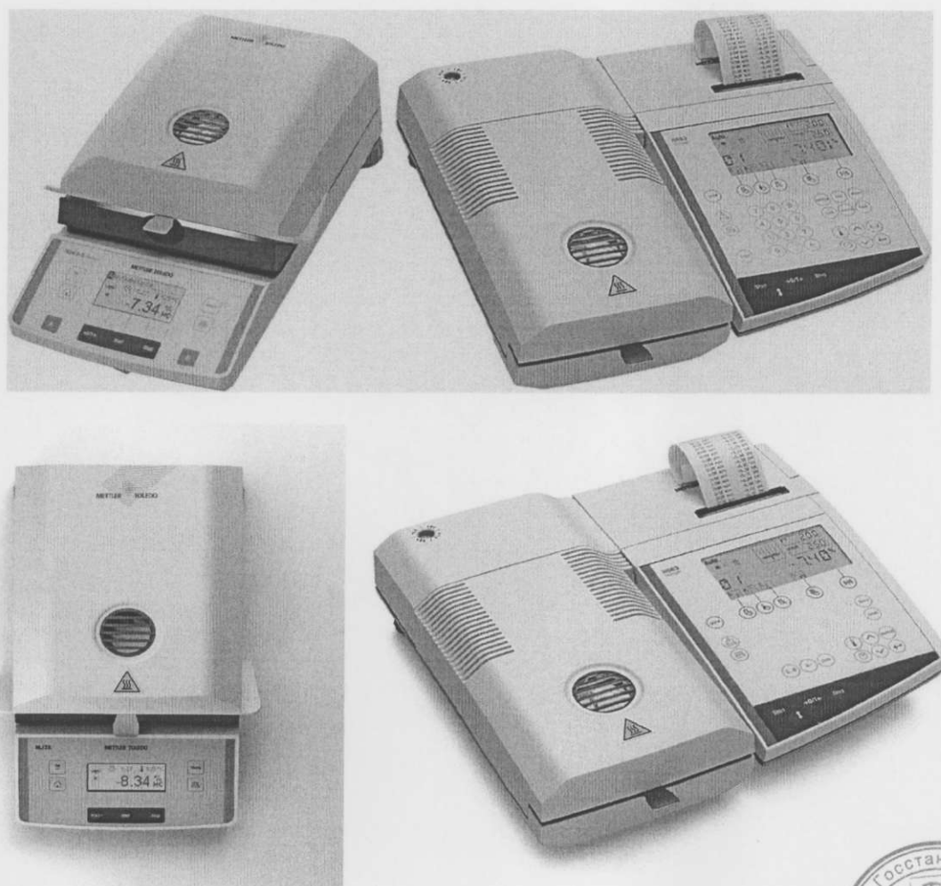
Рисунок 1 – Внешний вид анализаторов влажности

Внешний вид анализаторов влажности приведен на рисунке 1.