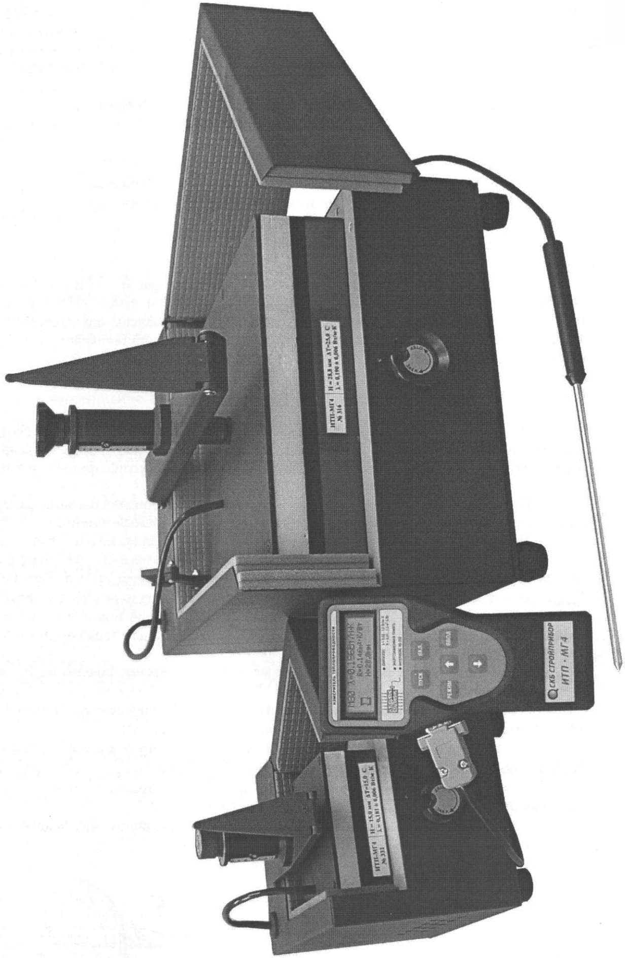
Рисунок 1 – Измеритель теплопроводности ИТП МГ4 модификация ИТП МГ4 «100», ИТП МГ4 «250/Зонд»